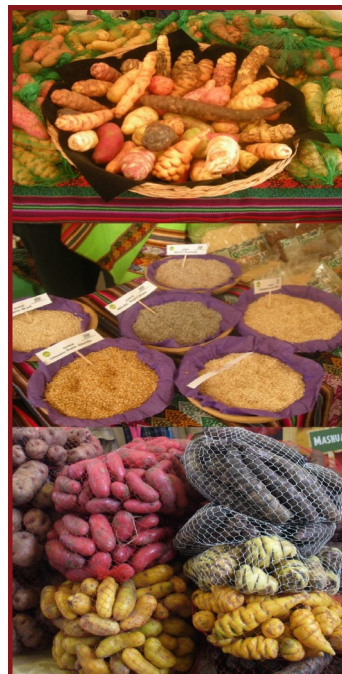
Variedades de oca, quinoa, allu y mashua.