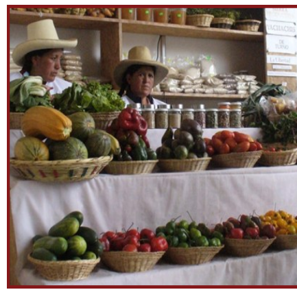
Agricultores ofertando productos ecológicos en Mística.