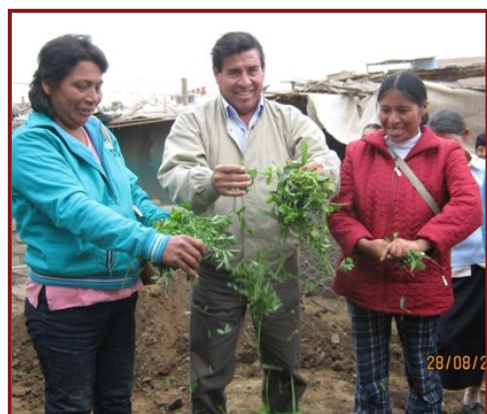
Agricultores trabajando en la elaboración de bocashi. Archivo fotográfico RAE Perú 2012